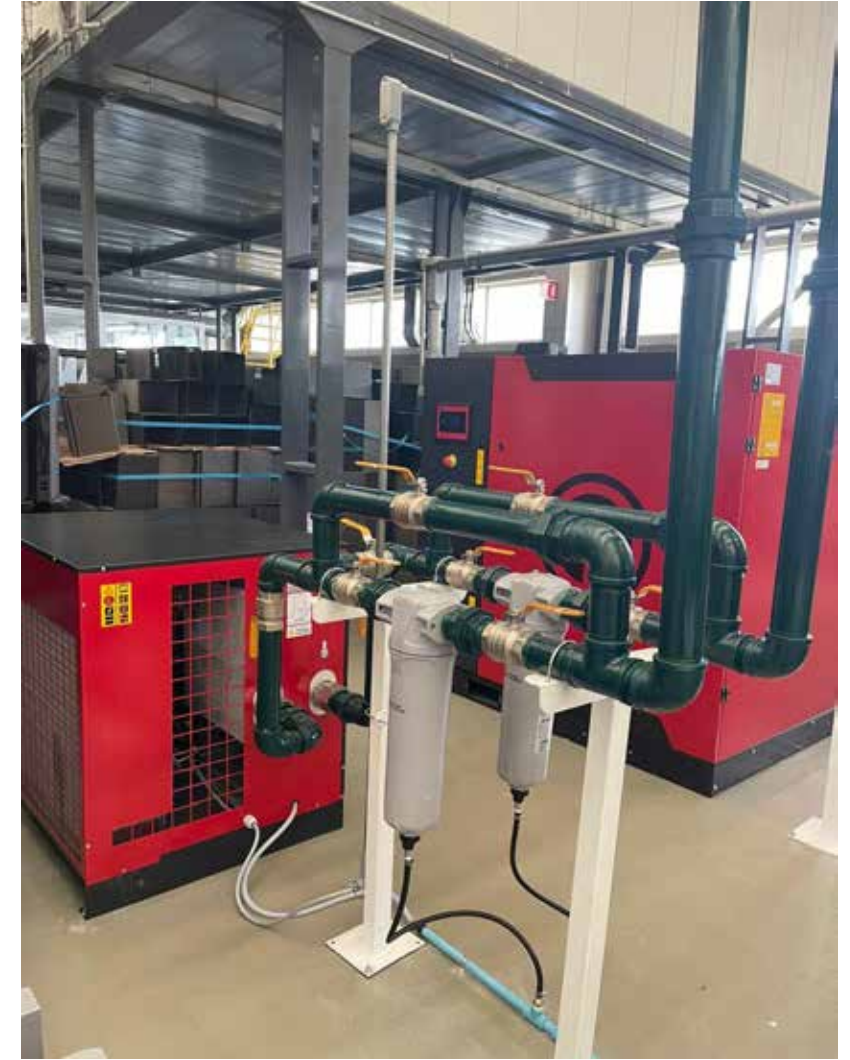
INSTALACION DE SECADOR MARCA CHICAGO