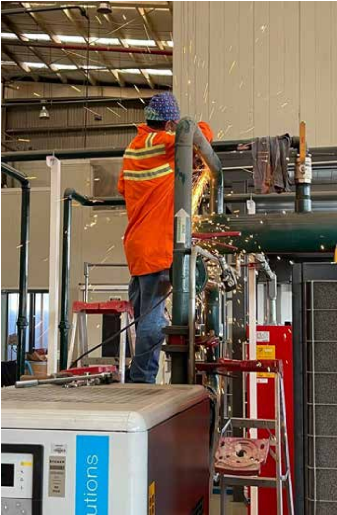
INSTALACION DE SECADOR MARCA BEKO