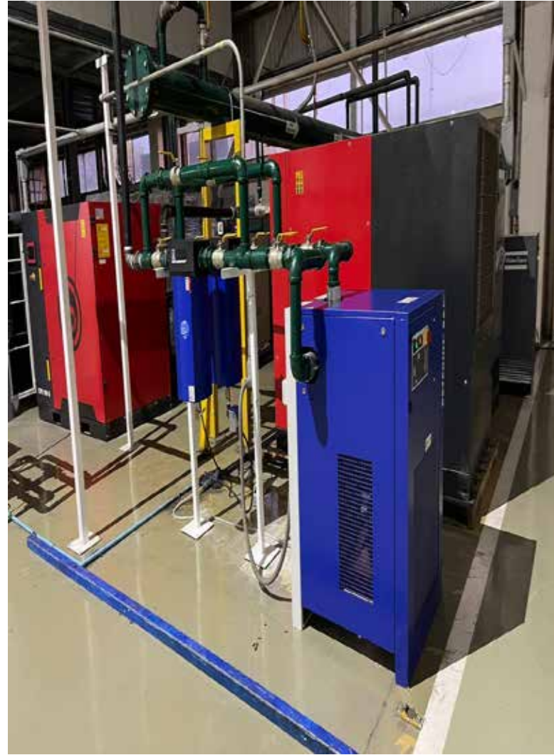
INSTALACION DE SECADOR MARCA BEKO