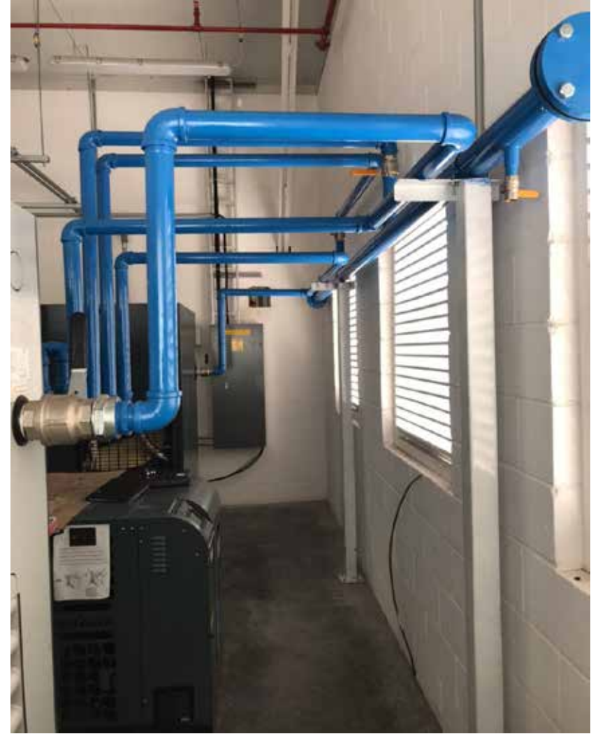
INSTALACION NEUMATICA DE COMPRESORES Y SECADORES MARCA ATLAS COPCO